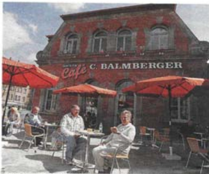
Statt Münzen gibt's Weggla, Brot, Kaffee und Kuchen: Die alte Prägeanstalt Balmbberger ist jetzt ein Café.