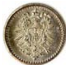
Kinderspielgeld Durchmesser 14 mm, Silber

Neben diesen Marken erschien ein neues Münzgepräge, das Miniaturgeld. Die kleingeprägten Umlaufwährungen wurden nicht nur intensiv gesammelt, sondern waren auch eine wichtige Ergänzung für alle Spiele mit Zähl- und Bezahlfunktionen. Die Bedeutsamkeit des Miniaturgeldes wird sehr anschaulich geschildert in den „Mittheilungen“ des Clubs der Münz – und Medaillenfreunde in Wien