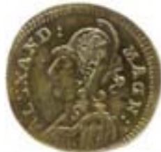
Rechenpfennig Durchmesser 20 mm, Messing