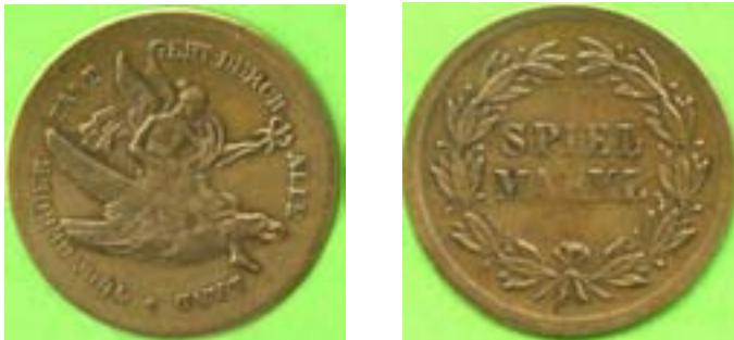
Nürnberger Tand geht durch alle Land / Spiel Marke