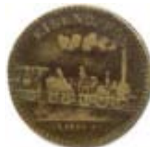
Spielmarke Durchmesser 20 mm, Messing

Veränderte Zeiten und neue Spielvorschriften ließen später auch die Nachfrage von Spielmarken schwinden. Daher produzierte man nun vermehrt „Bildermarken“. Was bisher nur die Rückseite der Spielmarke zierte, fand sich bei den Bildermarken auf Vorder- und Rückseite, also eine „Münze“ mit zwei Bildseiten, die beliebte Darstellungen zeigte. Ergänzt wurden die Motive nun besonders mit Abbildungen des technischen Fortschritts (z.B. Luftschiffe, Fahrräder, Autos usw.), der Entdeckungen und der markanten Persönlichkeiten dieser Zeit.