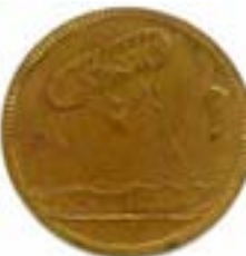
Bildermarke Durchmesser 20,5 mm, Messing